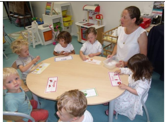
Jeu de loto sur les couleurs