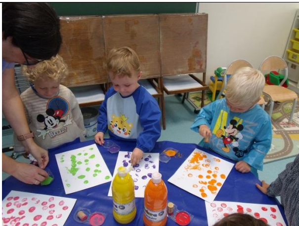
Peinture avec des bouchons